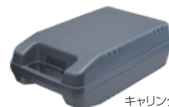
キャリングケース